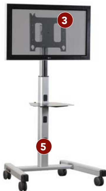
(Nella foto è presente lo scaffale PAC710, non incluso)